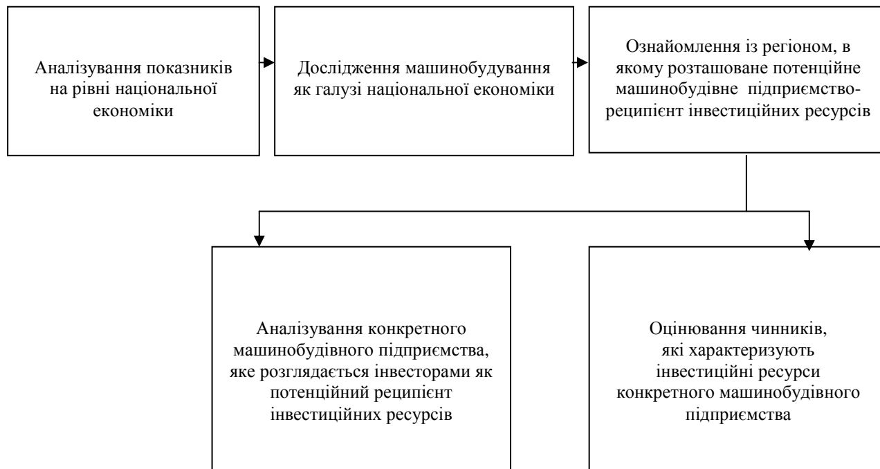
Рис. 1.2. Етапи аналізування показників, які характеризують ПМП

Ствердна відповідь на це питання залежить від того, наскільки конкурентною є галузь, яка у ній частка державних підприємств, чи галузь є експорторієнтованою тощо. Якщо загалом національної економіки і стан конкретної галузі є прийнятним для інвестування, то доцільним є проаналізувати привабливість регіонів для розвитку інвестиційної діяльності. Цей етап дослідження вимагає ознайомлення із місцевими підприємствами щодо їх інвестиційної привабливості та наявного у них обсягу інвестиційних ресурсів.