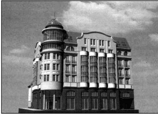
Рис. 5. Житловий будинок на вул.Валовій, 45 у Львові (архітектор О. Базюк, 2002 р.)

місцевості, проте вона не перегукується за стилем з навколишньою забудовою. Тобто історичний контекст для дніпропетровського архітектора не має такого важливого і вирішального значення, як, наприклад, для київських та львівських зодчих.