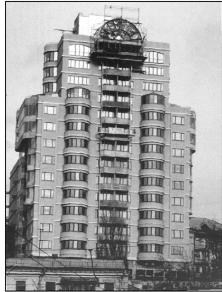
Рис. 6. Експериментальний енергоефективний житловий будинок на вул. Кропивницького у Києві (архітектор Л. Муляр, 2001 – 2002 рр.)