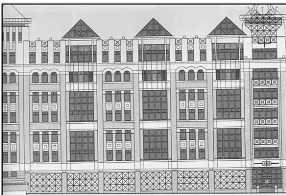
Рис. 3. Житловий будинок у Десятинному провулку, 3–5 у Києві (архітектури С. Бабушкін, А. Мазур 1997–1998 рр.)