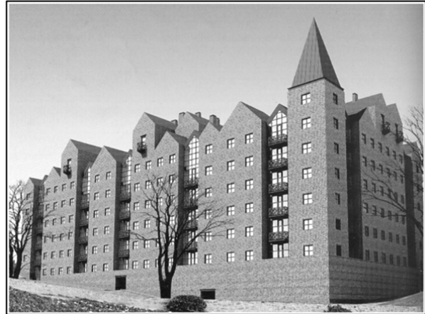
Рис. 2. Житловий комплекс “Амстердам” у Дніпропетровську (архітектори О. Дольнік, В. Сидоренко, 2004–2005 рр.)