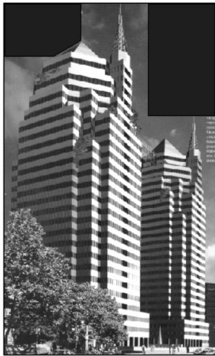
Рис. 7. Житловий комплекс “Вежі” у Дніпропетровську (архітектори О. Дольнік, С. Піщаний, В. Штефан, 1999–2003 рр.)

З використанням мотивів постмодерністичної архітектури без прив’язки до конкретного містобудівного оточення споруджено у Дніпропетровську житловий будинок на вул. Дашковича, 33 (архітектор Ю. Калашнік), житлово-громадський комплекс на вул. Соборній (архітектори М. Чабак, О. Слобода, О. Туркова).