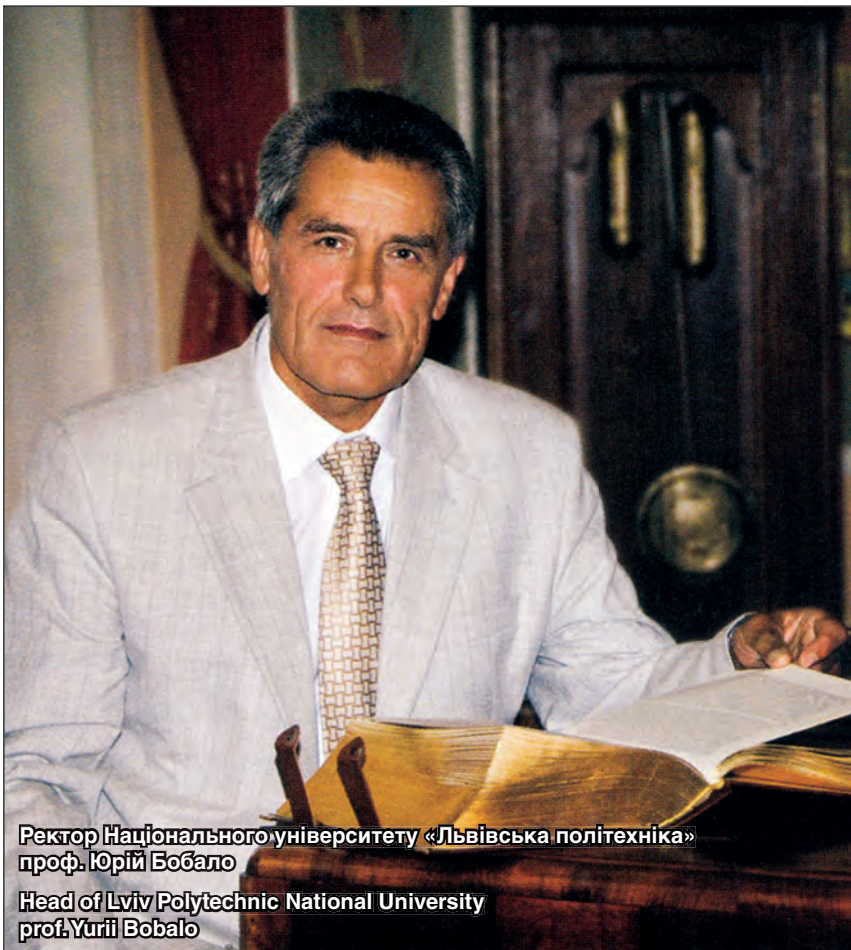
Ректор Національного університету «Львівська політехніка» проф. Юрій Бобало