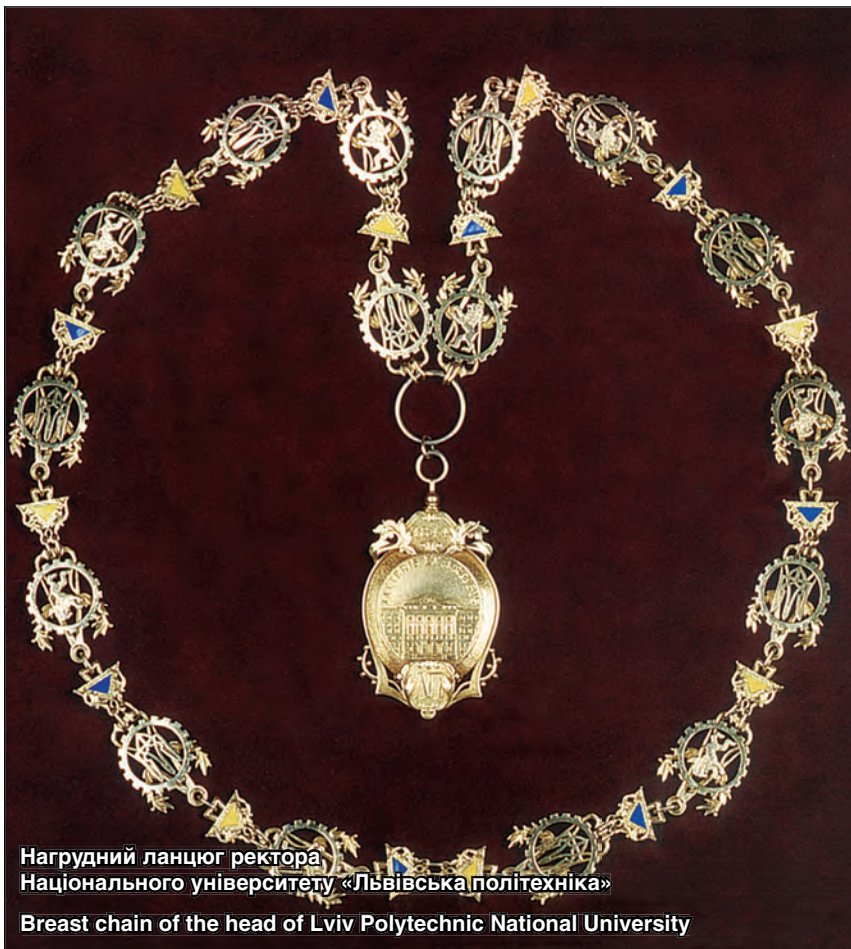
Нагрудний ланцюг ректора Національного університету «Львівська політехніка»

Breast chain of the head of Lviv Polytechnic National University