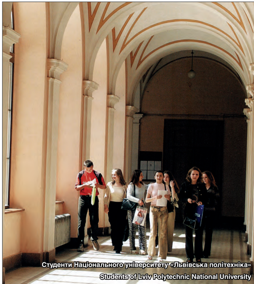
Студенти Національного університету «Львівська політехніка»