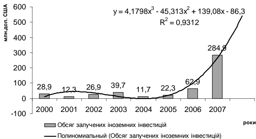
Рис. 1. Темпи надходження іноземних інвестицій у м. Львові за період 2000 – 2007 рр.

Основна діяльність департаменту сконцентрована на проведенні маркетингових заходів для залучення інвестицій. Здійснюється активна діяльність в цьому напрямі. Проте, як зазначалось вище, цей вид діяльності місцевої влади має незавершений характер, оскільки, залучивши інвестиції, недостатньо здійснюється аналіз діяльності інвестора, ступінь виконання його інвестиційних зобов'язань і не аналізується остаточний результат, отриманий від залучення іноземного капіталу. Впровадження логістичної системи для управління іноземними інвестиціями дасть змогу визначити наскільки ефективним є цей процес від зусиль із залучення до надання інвестору повної інформації про доцільність їх рішень, разом з цим це є потужним стимулом для повторного інвестування.