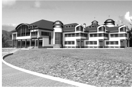
Рис. 4. Філософсько-богословський факультет УКУ