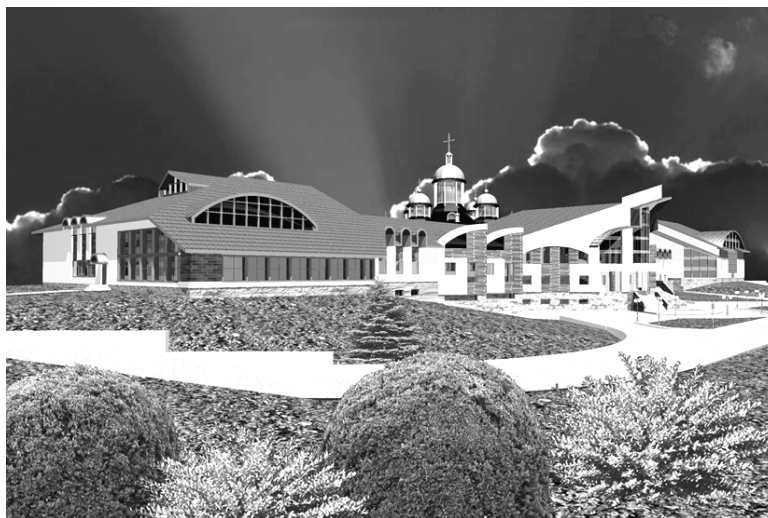
Рис. 2. Львівська Духовна Семінарія

До реалізації було прийнято варіант комплексу з внутрішнім („закритим”) храмом, який запроєктований в центрі семінарійного подвір'я (рис. 2, 3). Крім споруд семінарії (храм, адміністративно-навчальний корпус, харчоблок, спортивний блок), до складу комплексу увійшли споруди Філософсько-богословського факультету Українського Католицького університету (рис. 4), пасторально-місійного центру (рис. 5), монаші освітні будинки о.о. Редемптористів та о.о. Студитів, а також господарський будинок (рис. 6) та спортивні майданчики.