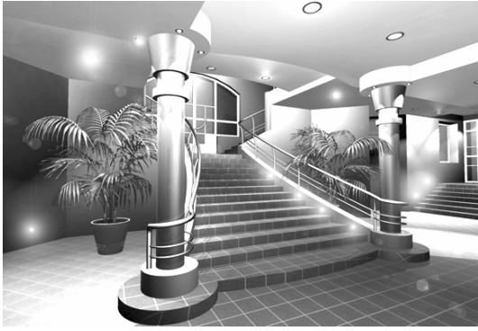
Рис. 3. Фрагмент інтер'єру Львівської Духовної Семінарії