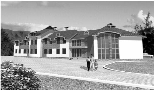
Рис. 5. Пасторсько-місійний центр