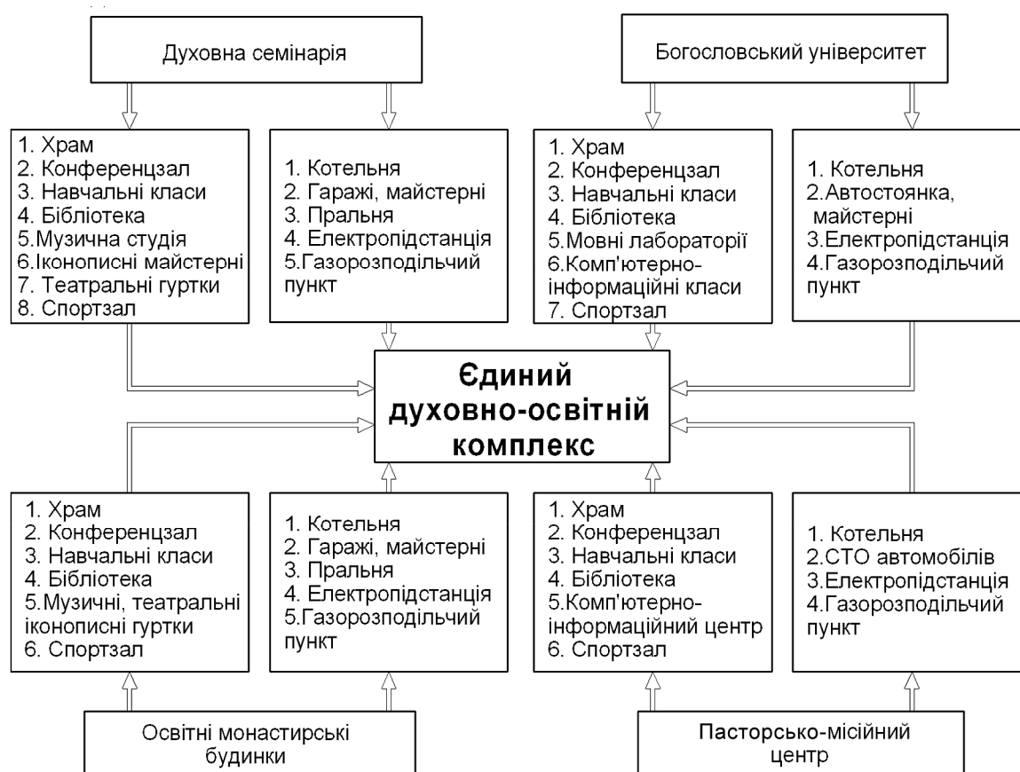
Схема делегування духовно-освітніх та господарських споруд єдиному духовно-освітньому комплексу існуючими закладами духовно-богословської освіти може мати такий вигляд:

Водночас частину спеціальних споруд та приміщень існуючих закладів духовно-богословської освіти передавати в спільне використання в межах єдиного духовно-освітнього комплексу є недоцільним. До таких споруд або приміщень належать: каплиці, класи та кабінети індивідуальної підготовки, музеї, житлові приміщення, господарсько-побутові кімнати, швейні та столярні