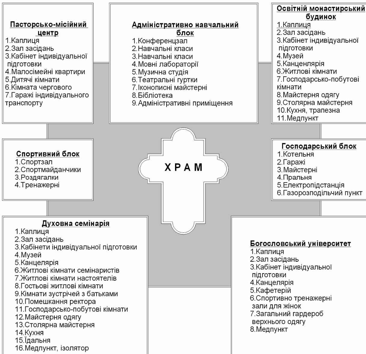
Рис. 1. Схема структури духовно-освітнього комплексу

Отже, розглянувши завдання в галузі духовно-богословської освіти, які стоять перед віродуховним освітнім закладом нового семінарійно-університетського типу, врахувавши духовні, освітні та житлово-побутові потреби кожного з духовно-освітніх закладів, що увійшли в єдиний комплекс нового типу, можна рекомендувати таку оптимальну структуру духовно-освітніх, житлово-побутових та господарських підрозділів об'єднаного духовно-освітнього комплексу семінарійно-університетського типу (рис. 1).