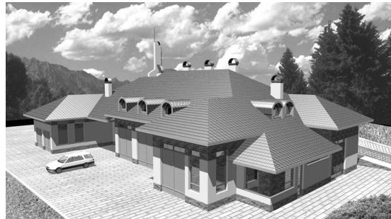
Рис. 6. Господарський будинок

Схему розташування та композиція основних споруд Центру Вищої Богословської освіти та формації УГКЦ у Львові на вул.Хуторівка наведено на рис. 7.