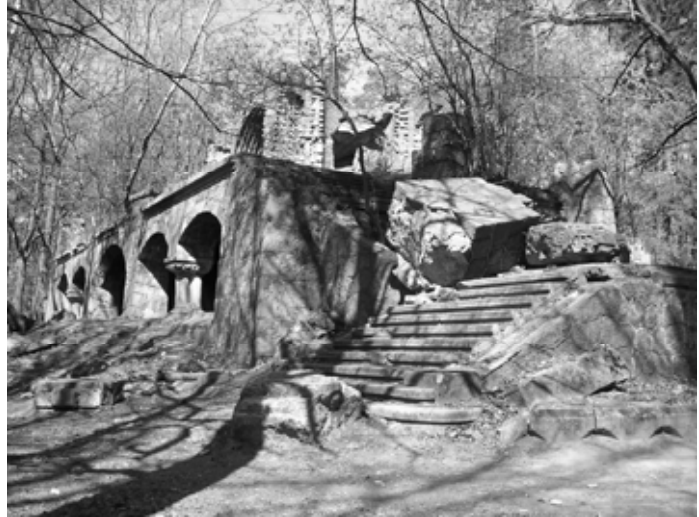
Рис. 2. Вежа Квісторна (п. XX ст.) і стан сучасний

У сусідньому лісопарку Глибокому з'явилася дільниця вілл, причому планом було передбачене забудову у лісових територіях. При озері Глибокому влаштовано міську купальню, закладено літній ресторан та відпочинковий будинок.