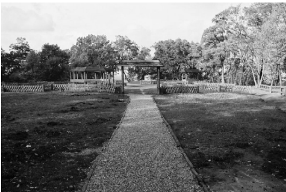
Рис. 4. Поляна Оглядова, подібно загосподаровані інші поляни в лісах Щеціна (Фото І. Пухала, 2006)

місцях, доступних для неповносправних осіб, які пересуваються на візках. Переважно поляни мають добре сполучення із мережею громадського транспорту.