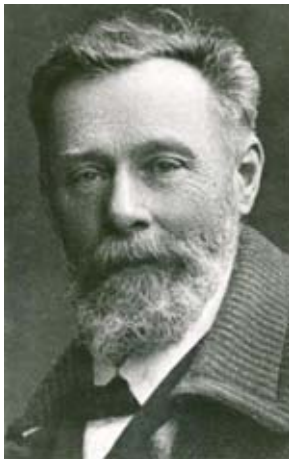
Рис. 1. Ян Томаш Кудельський (1861–1937)

Невідома донині творчість одного з видатних архітекторів Галичини Яна Томаша Кудельського (рис.1) стала віддзеркаленням змін, які називали наприкінці ХІХ – початку ХХ ст. Тоді в центральноевропейській архітектурі історизму поєднується з початками модернізму в широкому розумінні значення цього явища. Провінція має свої права. Тому поза столицями це поєднання не має характеру різкого зіткнення, а відбувалося помірковано, впродовж довшого часу. Кожне з менших міст Галичини мало власне обличчя, кожне власним поглядом вглядалося в бурхливий розвиток столиці “європейської провінції” – Львова. Львів ХІХ століття сформував смаки і уявлення галичан про архітектуру великого міста. Не був винятком і Станіславів – місто, де проживала сім'я Кудельських від 1893 до початку Першої світової війни. Ян Томаш Кудельський здобув фах архітектора у Львові, але найбільший його творчий розквіт припадає на станіславівський період. В місті над Бистрицями залишив Я.Т. Кудельський