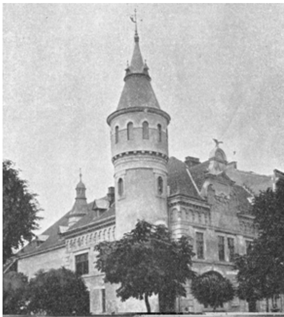
Рис. 3. Станіславів. Будинок польського гімнастичного товариства "Сокіл". 1894.

У Станіславові життя дому Кудельських мало богемно-мистецький характер. У ньому бували цікаві люди, письменники і митці, між інших Ян Каспрович і Станіслав Пшибишевський (обидва протягом короткого часу були вчителями в місцевій гімназії). Приятелем дому був історик Станіслав Колонна-Валевський.