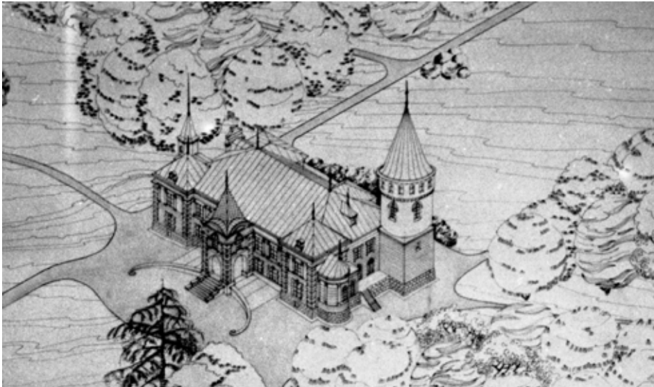
Рис. 2. Садиба Рея в Псарах (тепер село Приозерне Рогатинського району). Рисунок Зиновія Соколовського

Талант молодого архітектора визнали під час проведення Будівельної виставки 1892 р. Влаштовано її у головному корпусі Політехніки та в саду, що оточував будівлю. У відділі архітектури серед праць корифеїв архітектури – Теодора Тальовського, Вінцентія Равського, Францішка Сковрона, Альфреда Каменьобродського – розмістились також і проекти Я.Т. Кудельського [13]. Були серед них ранні ескізи і креслення, плани будинку Потоцького. Найбільшої похвали була удостоєна каплиця з химерами. Цікаво, що серед перелічених експонатів виставки згадується проект садиби графа Рея, виконаний Я.Т. Кудельським (рис. 2).