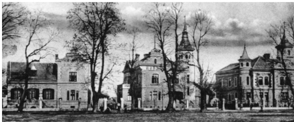
Рис. 4. Станіславів. Вілли по вул. Липовій (Шевченка). Почтівка з колекції автора

декорування фасаду не видається випадковою. Так само, як і подібність пропорцій і способу поєднання об'ємів в єдину композицію. В усіх цих будинках до корпусу доставлено круглу башту, увінчану конусоподібним дахом. Такий прийом привносив ноту романтизму, а спосіб komponування об'ємів став взірцем для наслідування в Станіславові і поза межами міста.