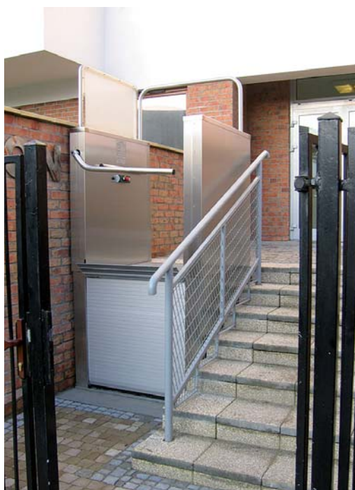
Рис. 4.17. Механізм вертикального підйому візочків з неповносправними на рівень майданчика перед входними дверима в будинок (Варшава)