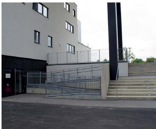
Рис. 4.20. Безбар'єрний вхід до житлового будинку (Відень, Братислава, Краків)