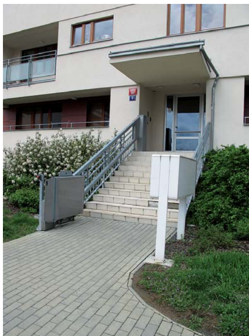
Рис. 4.18. Механізми для підйому візочків з неповносправними вздовж сходового маршу напрямними, встановленими паралельно до огорожень маршів (Прага)