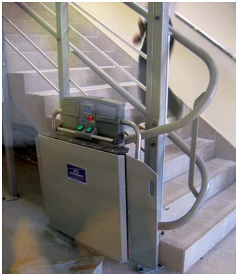
Рис. 4.19. Механізми для підйому по сходах візочків з неповносправними вздовж сходового маршруту напрямними, інтегрованими з огороженням маршів (Братислава, Жешув)