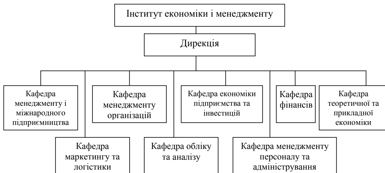
Рисунок 1. Структура Інституту економіки і менеджменту

У даний час в Інституті економіки і менеджменту працює близько 30 докторів економічних наук, професорів, понад 200 кандидатів економічних наук. Успішно функціонує докторантура та аспірантура, спеціалізована вчена рада із захисту докторських і кандидатських дисертацій.